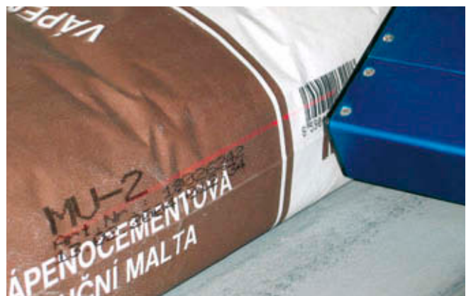
Beschriftung von Papiersäcken